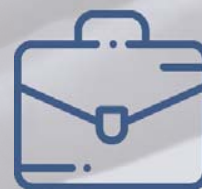
Casos prácticos reales